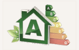
Calificación energética del edificio A

Esta vivienda cuenta con certificación energética A , lo que significa mayor confort térmico, menor consumo y un compromiso real con la sostenibilidad.